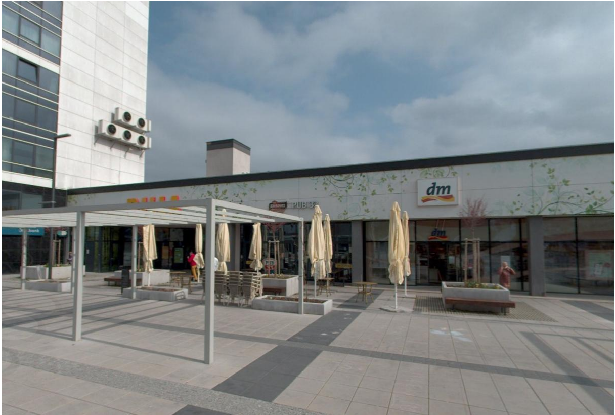
Fotodokumentácia predmetu nájmu