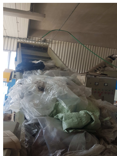
Pretriedenie plastového odpadu

Pridaním farbiva do suroviny možno novú fóliu farebne upravovať a k vám sa znova dostáva vo forme žltého vrecia –na odpad. Na výrobu 1 tony plastov sa spotrebuje až 2,5 tony ropy. Toto množstvo ropy je možné nahradiť 1,2 tonami zberových plastov. Pri takejto recyklácii dochádza k 97% úspore energií oproti výrobe z ropy. Ďalší dôvod, prečo sa oplatí odpad triediť a recyklovať. Preto vy len triedte a o ostatné sa postaráme my.