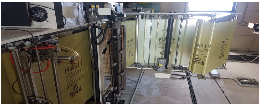
Finálna úprava plastových vriec