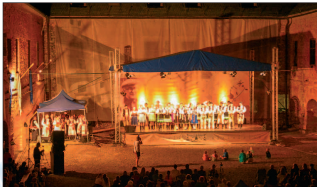
Večer na nádvorí Dubnického kaštieľa patrili bývalým členom FS Mladosť, ktorí svojím programom „Tanečným krokom k zlatu“ pozvali všetkých divákov na pripravované 50. výročie založenia súboru (2019).