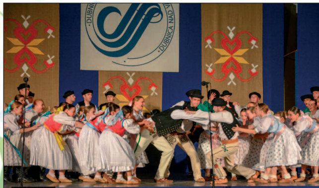
Galaprogram otvorili spoločným tanečným číslom domáci FS Mladosť s FS Rozsutec z Žiliny.