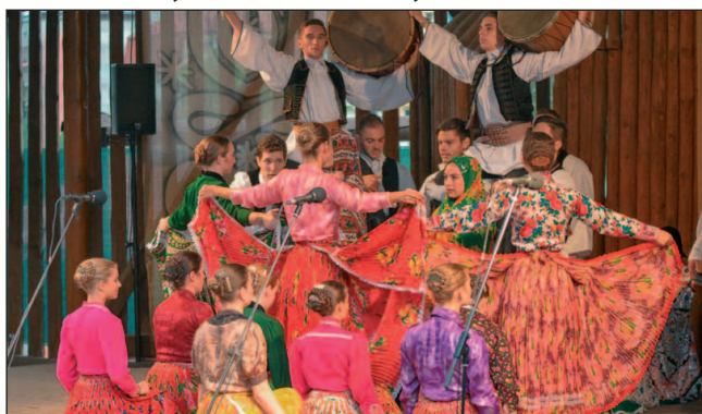
Obrovský úspech zožal i maďarský súbor Gődöllő táncegyüttes.