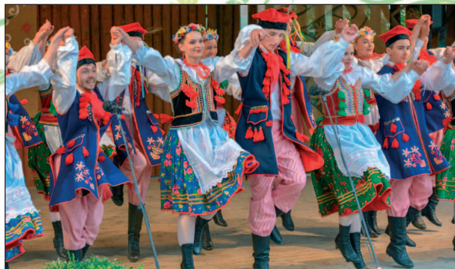
Nechýbali aj naši priatelia z Poľska – súbor Źędowanie ze Zawadzkiego.