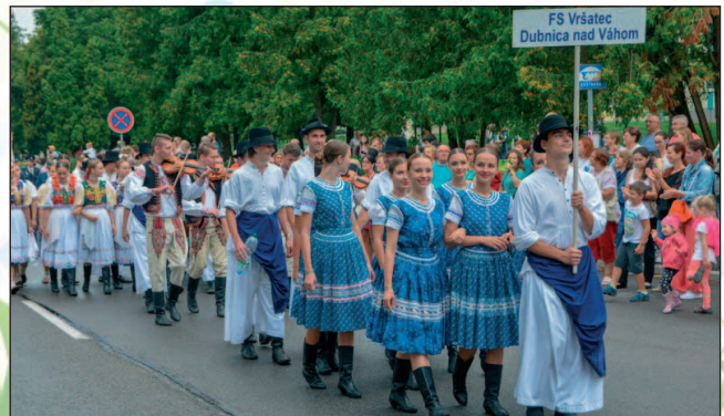
Nechýbal ani domáci Folklorný súbor Vršatec.