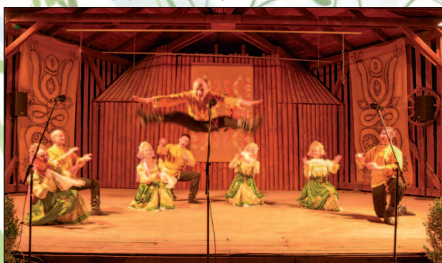
Ruský súbor Molodost' so speváckou skupinou Divo z Jaroslavl'u.