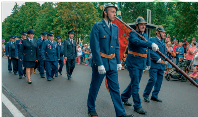
V sprievode sa predstavil i dubnický Dobrovoľný hasičský zbor, ktorý tento rok oslávil 135. výročie založenia.