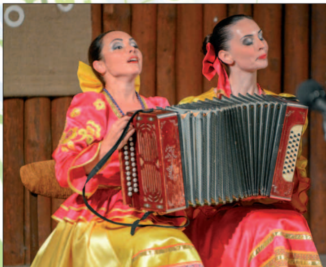
Diváci ocenili veľkým potleskom aj ďalší ruský súbor Elling z mesta Jaroslavl.