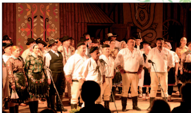
V sobotnom komponovanom programe „Paradzina“ sa predstavili výborní taneční, hudobní a speváci interpreti zo známejšou ZEM SPIEVA.