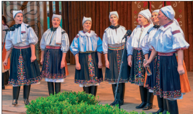
Dubnický folklórny festival sa tento rok konal už po 25. raz. Jeho súčasťou bolo aj vystúpenie FS Javorina zo Stráni na Morave