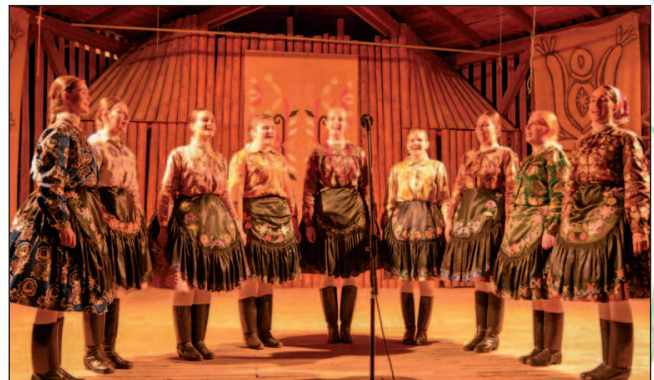
Folklorná skupina Škvarkare z Košickej Novej Vsi.