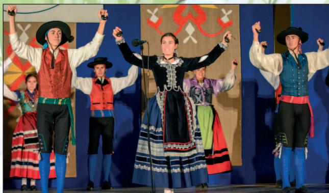
Zavítali k nám i hostia zo Španielska – súbor Grupo de danzas Vilalbilla de Burgos.