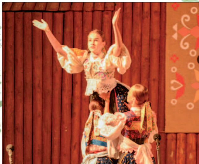
Folklorný súbor Marína zo Zvolena.