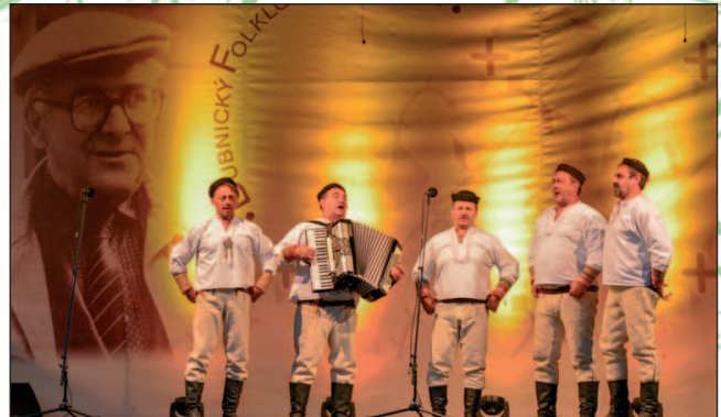
Otvárací ceremoniál otvorili silné hlasy spod Kráľovej hole v podaní Mužskej speváckej skupiny FSK Šumiačan zo Šumiac.