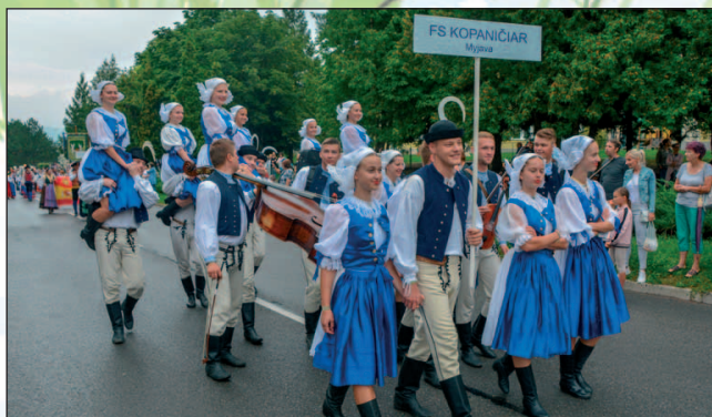
Folklorný súbor Kopaničiar z Myjavy, ktorý sa stal i Laureátom 25. ročníka DFF.