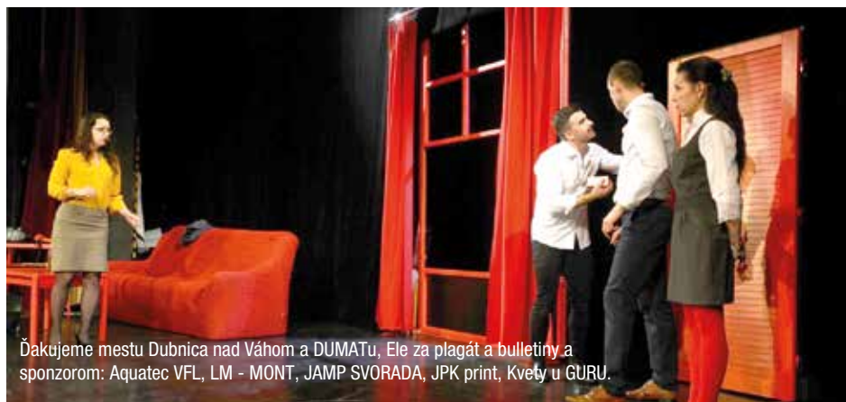
Ďakujeme mestu Dubnica nad Váhom a DUMATu, Ele za plagát a bulletiny a sponzorom: Aquatec VFL, LM - MONT, JAMP SVORADA, JPK print, Kvetý u GURU.