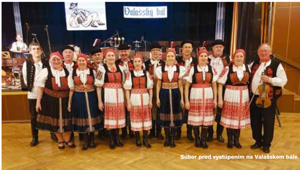
Súbor pred vystúpením na Valašskom bále.

O týždeň na to sa vo Valašských Kloboukoch konal 36. ročník krojovaného Valašského bálu, ktorého sa zúčastnilo viacero folklórnych súborov, dve dychové a dve cimbalové hudby. Súbor Senior Vršatec tu ako jediný hosť zo Slovenska v krátkom kultúrnom programe predviedol tanec Trenčín a jeho temperamentné vystúpenie so „zdvíhačkami“ zožalo búrlivé ovácie publika. Valašský bál, ktorý začínal pôsobivým nástupom krojovaných súborov, mal vysokú úroveň a veľmi príjemnú atmosféru. Sme radi, že sme k nej mohli prispieť i my prezentáciou slovenského folklóru.