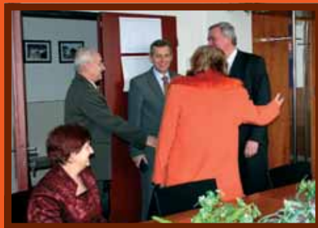
Pri návšteve okresu zavítali aj na mestský úrad.