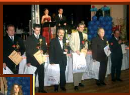
Súčasťou plesu bolo vyhlásenie najúspešnejších športovcov a športových kolektívov. Medzi ocenenými nechýbali ani zástupcovia nášho mesta.

Aj tento rok sa v Lednických Rovniach konal Ples športovcov okresov Považská Bystrica, Púchov a Ilava.