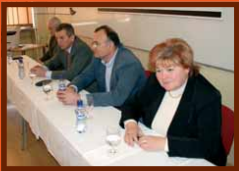
Poslanci navštívili aj Gymnázium v Dubnici n/V, kde okrem iného absolvovali aj zaujímavú diskusiu so študentami.