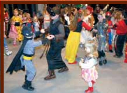
Šiškabálu pred OD ABC sa zúčastnilo veľa ľudí.