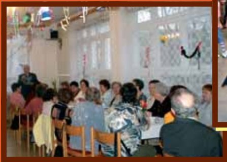
Fašiangy oslávili aj naši dôchodcovia

Počas fašiangového obdobia sme v uliciach Dubnice mohli stretnúť veselé masky