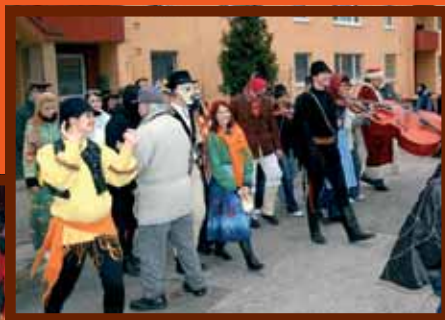
Deti sa ako každý rok najviac tešili na karneval